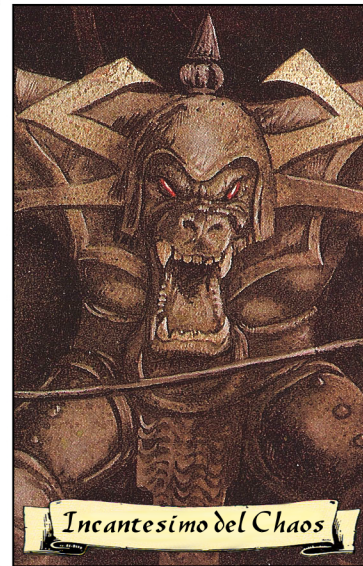
Incantesimo del Chaos