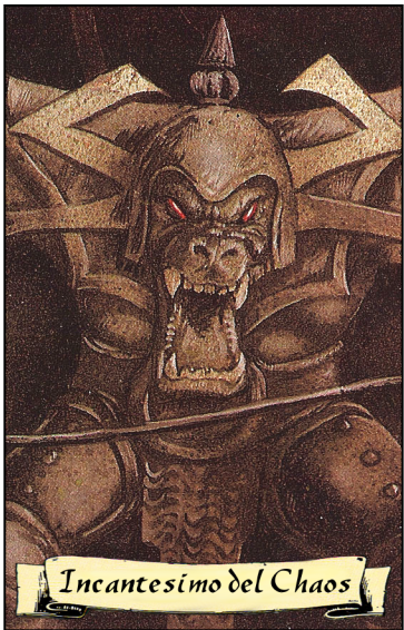
Incantesimo del Chaos