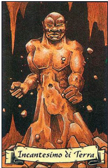
Incantesimo di Terra