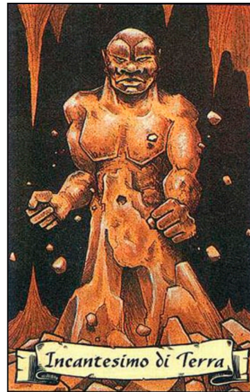
Incantesimo di Terra